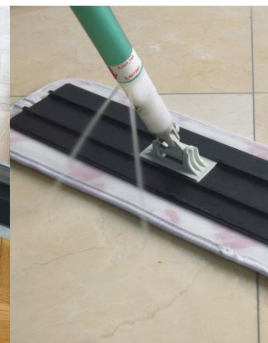
System Easy Scrub