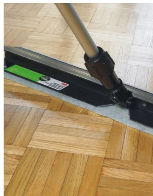
System Easy Trap