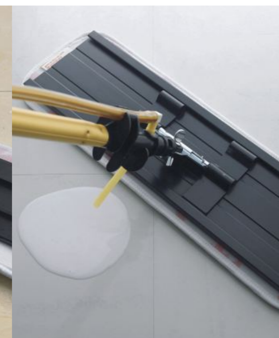
System Easy Shine

Odkurzanie Easy Trap Czyszczenie na mokro Easy Scrub Nakładanie powłok Easy Shine